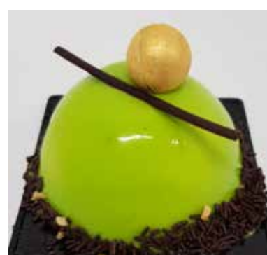
CLARISSA Bavarese al pistacchio ripiena di mousse alla nocciola. Cuore di salsa alla nocciola e granella croccante. Biscuit al cacao Allergeni** 6,00 €