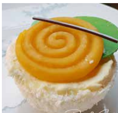
CASSIOPEA Mousse al cocco ricoperta di cioccolato bianco e cocco. Ananas fresco spadellato Gele al frutto della passione Allergeni* 6,00 €