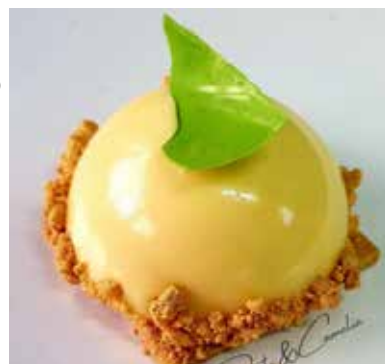
DELIZIOSA Mousse al limone Cremoso al limone e zenzero fresco. Dacquoise alle mandorle Crumble al caramello Base di biscotto di frolla Allergeni** 6,00 €