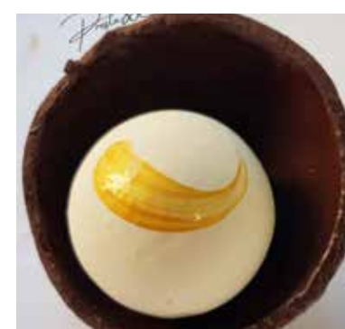
TORTUGA Mousse al cocco Crocante di wafer al cocco perle di succo di mango pan di spagna. Biscotto di frolla al cacao Allergeni** 6,00 €