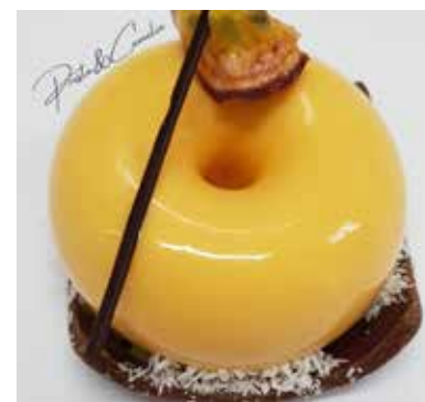
ESOTICA Mousse al mango e frutto della passione. Dadolata di frutta e esotica (mango, papaya, ananas..) Base di biscotto sablè al cacao Allergeni** 6,00 €