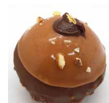
IL MONDO Cremoso alla nocciola Piemonte IGP. Salsa alla nocciola con granella croccante. Cake al doppio cioccolato Glassa e nocciole tostate Allergeni** 6,00 €