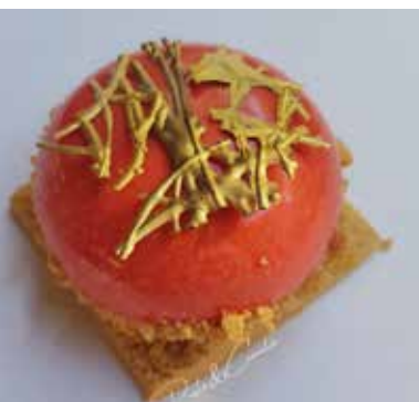
DIVINA Cremoso al cioccolato bianco Dadolata di fragole saltate Crumble al caramello Base di biscotto di frolla Allergeni** 6,00 €