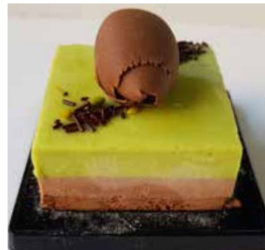
TRIS DI CIOCCOLATI AL PISTACCHIO Mousse al cioccolato fondente, cioccolato latte al PISTACCHIO. Base di biscuit al cacao Allergeni** 6,00 €