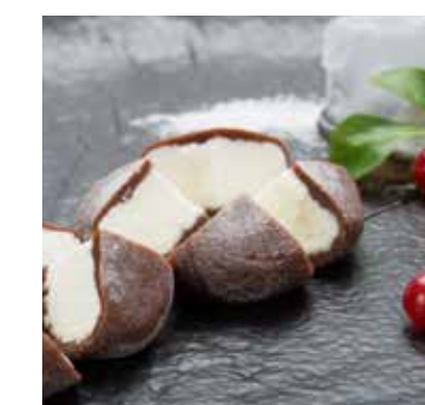
MOCHI GELATO • Vaniglia e cioccolato • Fior di ciliegio • Frutto della passione • Tè verde Allergeni** 5,00 €