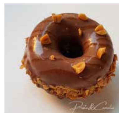
GOLD SNICKERS Mousse al caramello salato Mousse al cioccolato al latte Cuore di caramello e arachidi salate, pan di spagna, copertura Roché Allergeni** 6,00 €