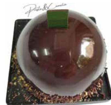
SATURNIA Mousse al cioccolato fondente Cuore di marmellata ai lamponi Biscuit al cacao senza farina Glassa lucida al cacao Allergeni** 6,00 €