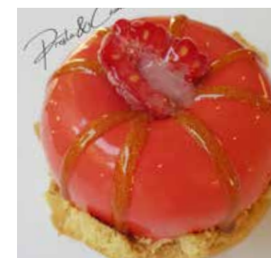
REDBERRY PASSION Mousse al lampone Cremoso al mascarpone, lamponi freschi. Perle di rice crispy croccanti Pan di spagna Base di biscotto frolla Allergeni** 6,00 €