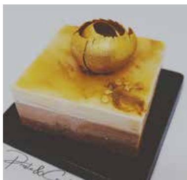
TRIS DI CIOCCOLATI AL CAMELLO Mousse al cioccolato fondente, cioccolato latte, al CAMELLO Base di biscuit al cacao Allergeni** 6,00 €