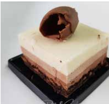
TRIS DI CIOCCOLATI Mousse al cioccolato fondente, cioccolato latte cioccolato bianco Base di biscuit al cacao Allergeni* 6,00 €